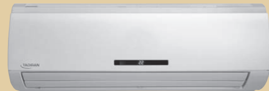
TADIRAN-N INVERTER 100N

קדמת הטכנולוגיה בעיצוב יוקרתי פסגת הקידמה במיזוג לקירור וחימום החדר במהירות, יציבות אופטימלית של טמפרטורה וחיסכון ניכר בחשמל. שימוש בטכנולוגיית SINGLE ROTARY