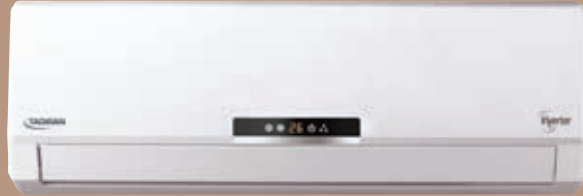
TADIRAN-R INVERTER 250, 350