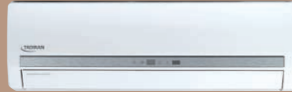
TADIRAN-R INVERTER 100, 150, 200

קדמת הטכנולוגיה בעיצוב יוקרתי פסגת הקידמה במיזוג לקירור וחימום החדר במהירות, יציבות אופטימלית של טמפרטורה וחסכון ניכר בחשמל. שימוש בטכנולוגיית TWIN ROTARY